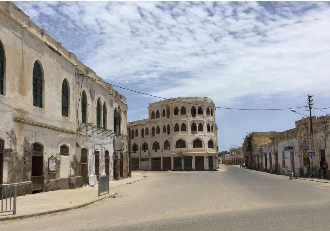
Hotel Torino, 1940, Massáua, Eritrea

Durante l'incontro verranno proiettate raccolte fotografiche e video dell'Eritrea dal periodo coloniale ai giorni nostri.