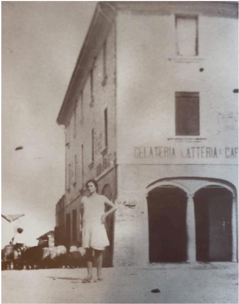
Casteldebole negli anni dopo la 1° Guerra Mondiale