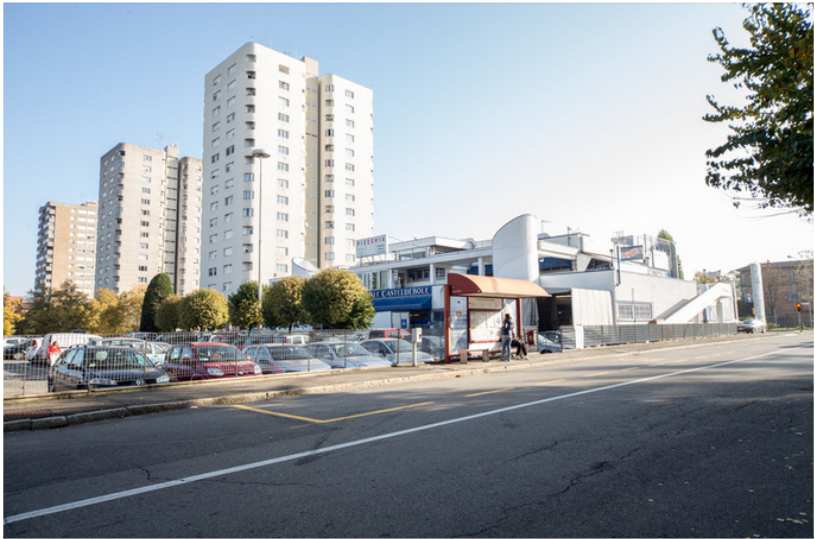
Centro Commerciale Casteldebole 2020