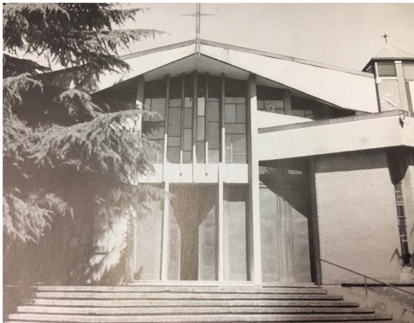
Chiesa dei Santi Giovanni Battista e Gemma Galgani Casteldebole anni '80