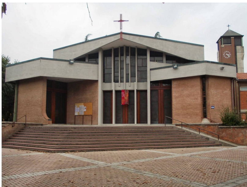
Chiesa dei Santi Giovanni Battista e Gemma Galgani Casteldebole 2020